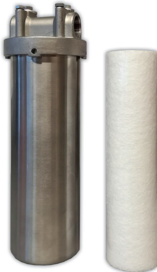
GebFilter sivuvirtasuodatin ja vaihdettava suodatinpatruuna