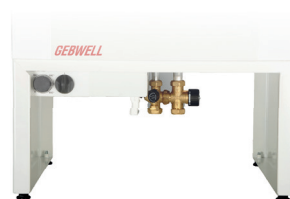
Sähkölaitteet ja putkisto ovat suojassa irrotettavan huoltokannen takana.