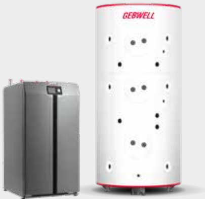
T 2 热泵和 G-Energy 蓄热罐