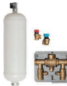
Maapiirin täyttöventtiiliryhmä DN25

Venttiiliryhmä on tarkoitettu kaikkiin Gebwell lämpöpumppuihin lisävarusteeksi.