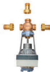
Käyttövesipaketti 4-8 asuntoa

Käyttövesipaketti sisältää 3-tieventtiilin ja toimilaitteen sekä liittimet, mutterit ja anturin. Käyttövesipaketti siirtimellä sisältää lämmönsiirtimen, kiertovesipumpun ja liittimet sekä anturin.