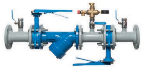
Maapiirin täyttöventtiiliryhmä DN65-80