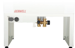
Sähkölaitteet ja putkisto ovat suojassa irrotettavan huoltokannen takana.